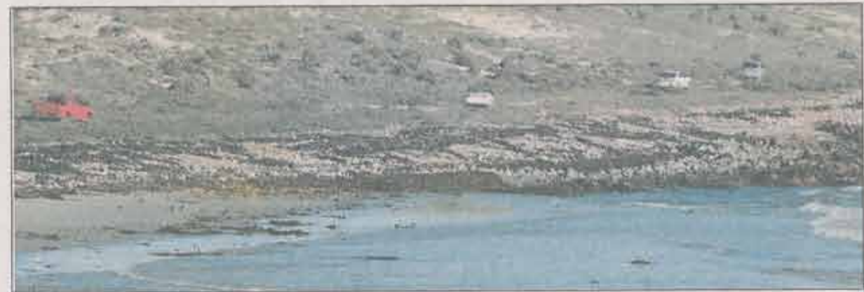
Só is met 4x4-voertuie al langs die Namakwalandse kus tussen die Groenrivier en die Spoegrivier gery. Dit is nou deel van die Namakwaland Nasionale Park en jy het viertrek nodig vir die dik sand aan die kus.