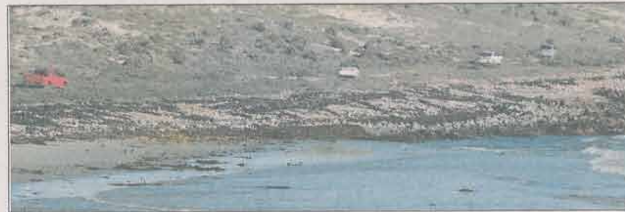
Só is met 4x4-voertuie al langs die Namakwalandse kus tussen die Groenrivier en die Spoegrivier gery. Dit is nou deel van die Namakwaland Nasionale Park en jy het viertrek nodig vir die dik sand aan die kus.